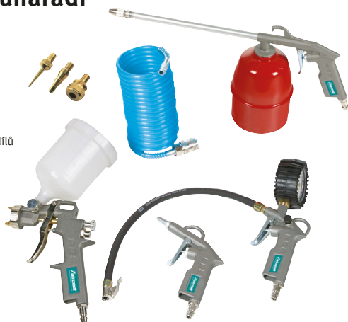
Sada pneunáradí 8 dílů

Sada pneunáradí, 6 dílů 2102006 669 Kč ▶ Sada obsahuje: Pneuhustič SD, ofukovací pistole BPK, kvalitní spirálová PU hadice, sada adaptérů Sada pneunáradí, 7 dílů 2102007 1 149 Kč ▶ Sada obsahuje: Pneuhustič SD, ofukovací pistole BPK, kvalitní spirálová PU hadice, sada adaptérů, stříkácí pistole Sada pneunáradí, 8 dílů 2102008 1 299 Kč ▶ Sada obsahuje: Pneuhustič SD, ofukovací pistole BPK, kvalitní spirálová PU hadice, sada adaptérů, stříkácí pistole, mlžící pistole