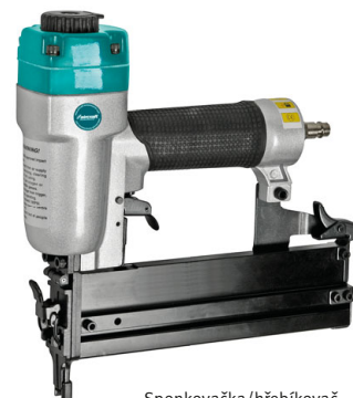
Sponkovačka/hřebíkovač NKG 40/50 PRO