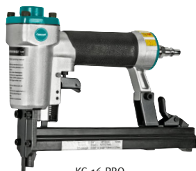
KG 16 PRO