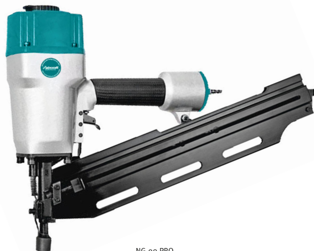
NG 90 PRO

Spotřeba vzduchu 1,8 l/výstřel Pracovní tlak 6 bar Hmotnost 3,1 kg