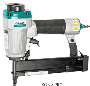
KG 32 PRO