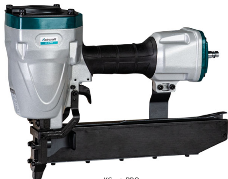
KG 50 PRO