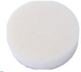
10 Měkký leštící kotouč