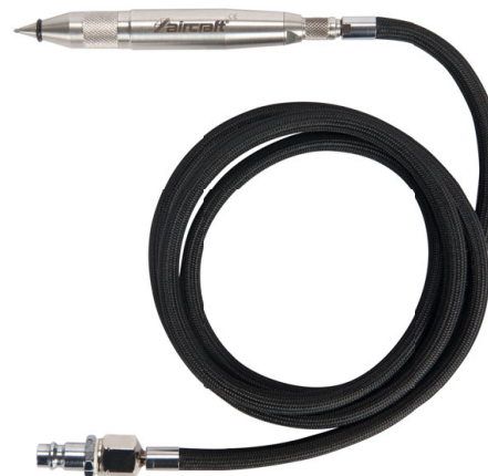
2 GS PRO