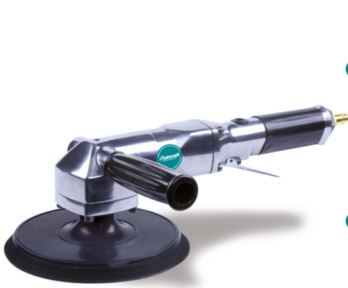
4 PS 7