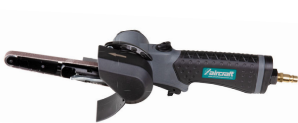
1 BS-C 10 PRO VS