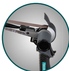
Rameno je otočné o 360°