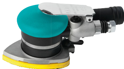
3 Delta bruska DS