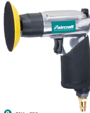
8 PSM 3 PRO