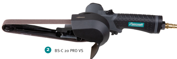
2 BS-C 20 PRO VS