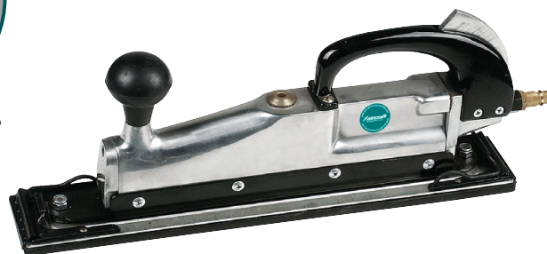
3 BDS PRO