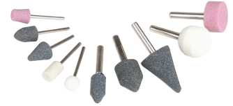
Sada brusných nástavců