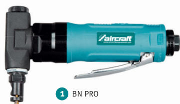
1 BN PRO