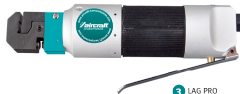
3 LAG PRO