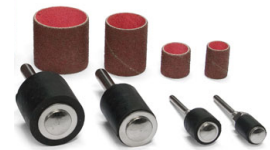
Sada brusných válečků