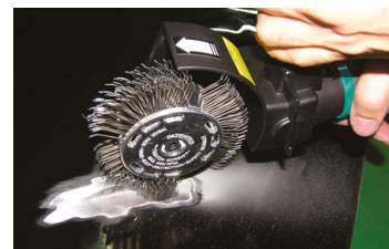
Drátěný kartáč hrubý 23 mm