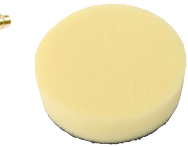
6 Náhradní gumový kotouč