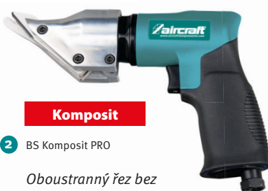
2 BS Komposit PRO