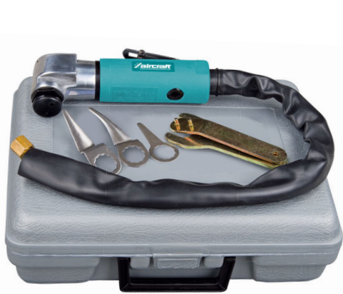
1 SZ PRO