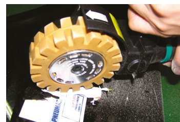
Gumový kotouč žlutý