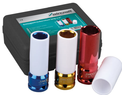
4 Utahovací nástavce 1/2" pro kola z lehkých slitin