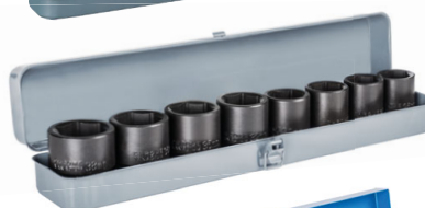
2 Sada utahovacích ořechů 3/4"