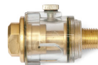
5 Hadicový přimazávač