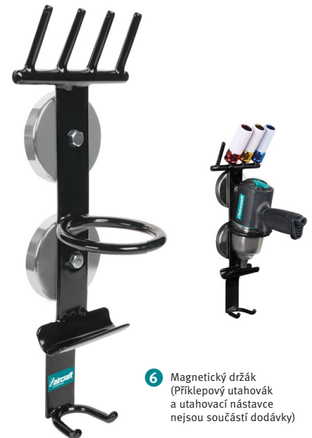
6 Magnetický držák (Příklepový utahovák a utahovací nástavce nejsou součástí dodávky)