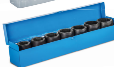
3 Sada utahovacích ořechů 1"